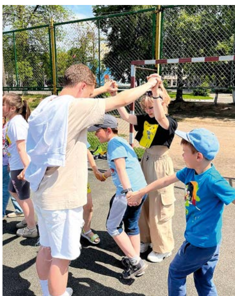
Подготовка инструкторов в летнем лагере СОШ №2

В 2023 году Межрегиональная Молодежная Общественная Организация «Дом Мира» реализовала социокультурный проект ИгроФест «Национальный колорит». Он был поддержан Белорусской Ассоциацией клубов ЮНЕСКО, а региональное Министерство внутренней политики на конкурсной основе предоставило грант на его реализацию.