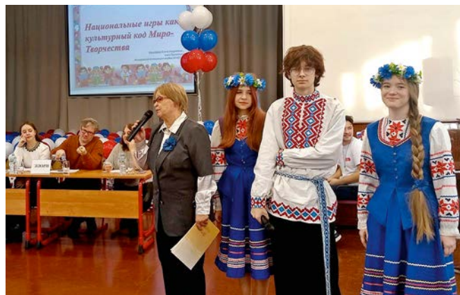
Белорусы – инициаторы дискуссии на тему «Национальные игры как культурный код «Миро-Творчества»

Победителей определяли в двух номинациях – «Рольевые, познавательные и обрядовые народные игры» и «Подвижные народные игры». Поскольку ряд заявок поступил от фольклорных коллективов – а они объединяют